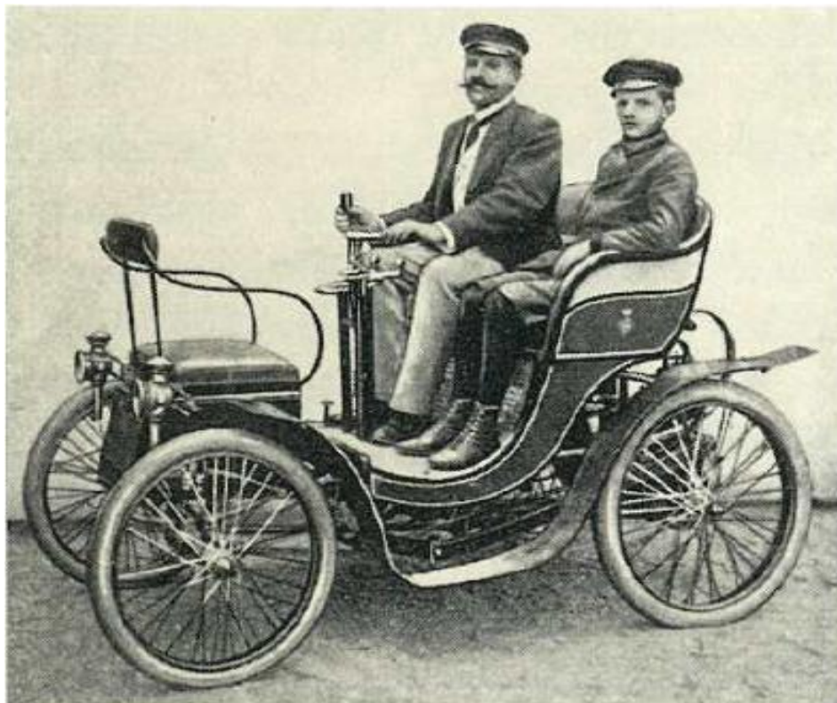
Pittlers „Hydromobil“ mit Wilhelm von Pittler am Steuer (1898).